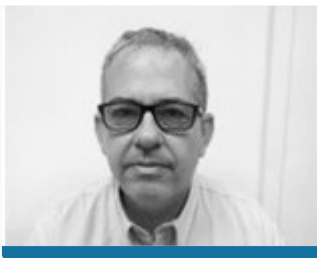
Jefe de Inspección. Ayuntamiento de Castellón.