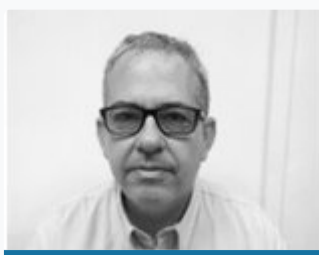
Jefe de Inspección. Ayuntamiento de Castellón.