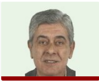
(UMCOAP). Secretario de la Comisión de Tejidos y Tumores del Departamento de Salud 2 de Castellón.