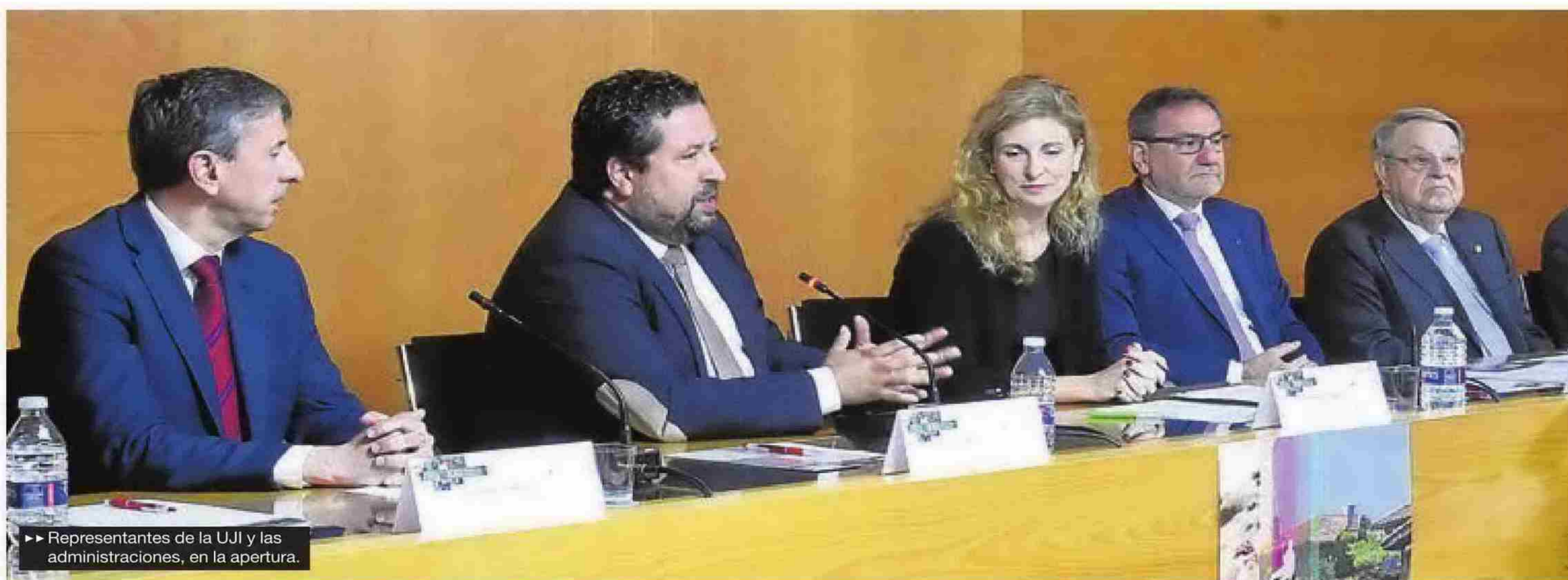
►► Representantes de la UJI y las administraciones, en la apertura.

EL CÓNCLAVE INTERNACIONAL ANALIZA LOS TERRITORIOS RURALES