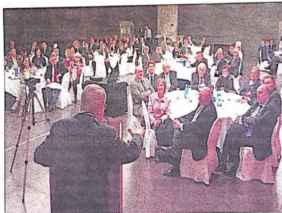
Numeroso público del mundo empresarial acudió al acto.

la UJI: visión innovadora, clarividencia y liderazgo».