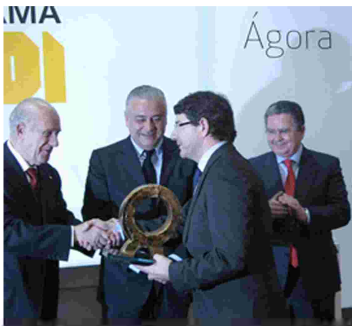
La empresa Ceracasa ha sido certificada por Aenor como la primera empresa cerámica en Gestión Energética de España y la primera de la Comunitat Valenciana relacionada con la construcción.