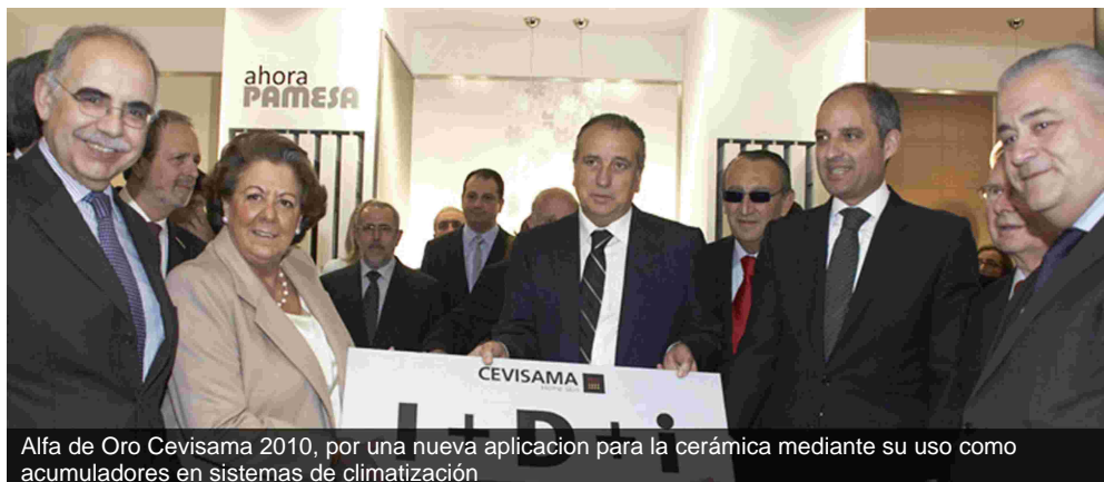
Alfa de Oro Cevisama 2010, por una nueva aplicación para la cerámica mediante su uso como acumuladores en sistemas de climatización

Por su parte, la empresa Ceracasa ha sido certificada por Aenor como la primera empresa cerámica en Gestión Energética de España y la primera de la Comunidad Valenciana relacionada con la construcción.